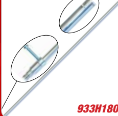
44" Extension Extension 44"