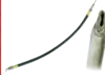
30" Rubber extension Ext. en caoutchouc 30"