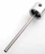
Cap & Needle Bouchon et tige