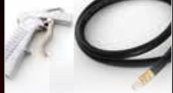
Gun & Hose Pistolet et boyau