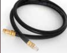
Flexible Hose Boyau flexible