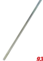
Angular Tube Tube angulaire