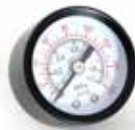
Pressure Gauge Manomètre