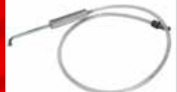
Hook Probe Sonde avec buse