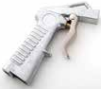
Swivel Gun Pistolet pivotant