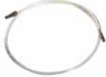
Nylon Probe Sonde en nylon