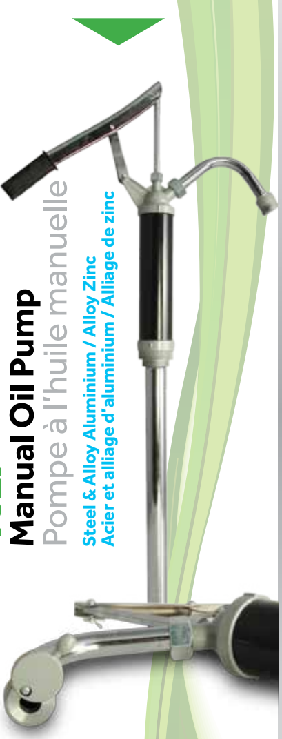
102P Manual Oil Pump Pompe à l'huile manuelle Steel & Alloy Aluminium / Alloy Zinc Acier et alliage d'aluminium / Alliage de zinc

Flow rate: Débit: 0.5L/stroke/course Inlet tube: Goulot: 1 inch/pouce Outlet tube: Sortie: 3/4 inch/pouce Adapter: Adaptateur: 2 inch/pouce NPT Suction pipe: Tuyau d'aspiration: 480mm-890mm